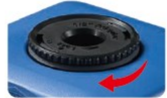
Coupleur 1/2" NC-75-022