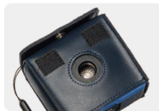
Étui souple NC-75-011