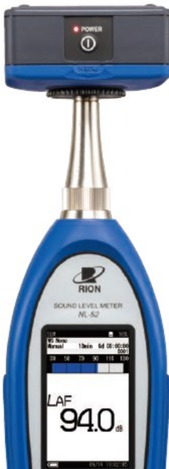
Calibrage sonomètre NL-52