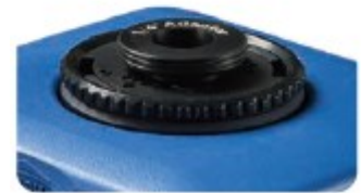
Coupleur 1/4" NC-75-S11 (option)