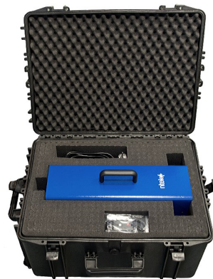
Caisse rigide TPM-CASE (option)