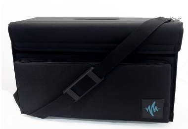
Sacoche rembourrée TPM-BAG (option)