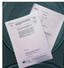
Certificat de calibration selon la norme ISO 16283-1 TPM-CL (option)