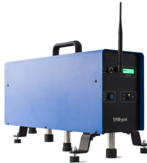
Machine à choc TPM-Pro